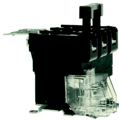
Figure / Figura / Figure 2